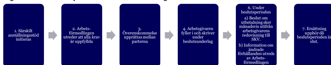
Figur 4. Ärendekedjan för särskilt anställningsstöd