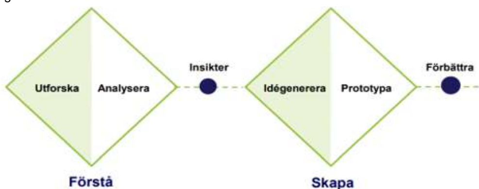
Figur 1. Double diamond

En workshopserie om två tillfällen har genomförts för ersättningarna arbetslöshetsersättning, aktivitetsstöd, etableringsersättning och utvecklingsersättning och en workshopserie om två tillfällen för de ersättningar som utgår för resor. Det första tillfället handlade om att utforska och analysera, det andra om att idégenerera och identifiera möjlig utveckling.