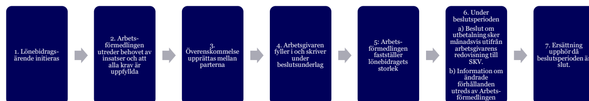
Figur 2. Ärendekedjan för lönebidrag

Nedanstående figur beskriver ärendekedjan för lönebidrag.